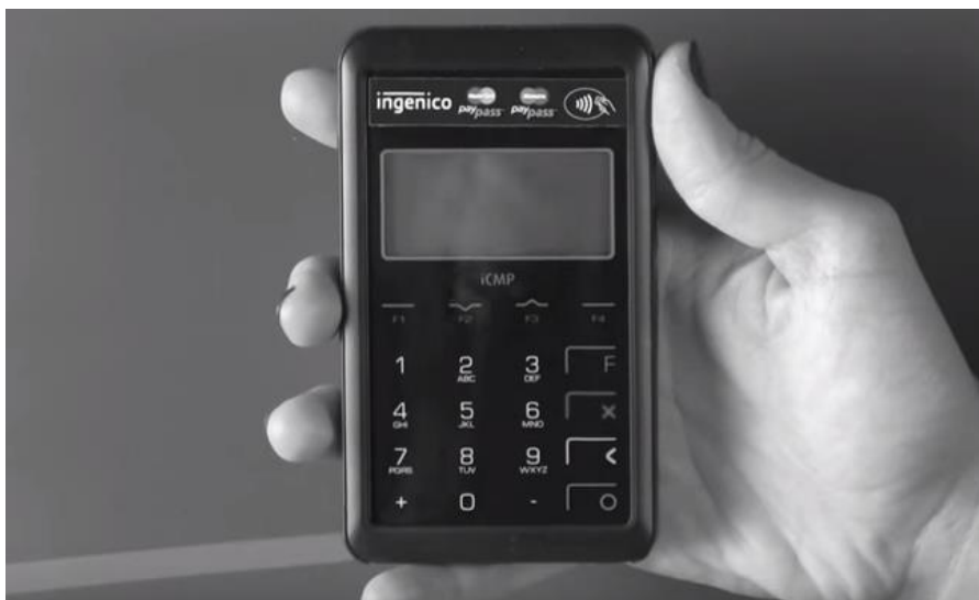
Videó a ReadyPay működéséről

„A ReadyPay egy egészen új, a kis és középvállalatok életét megkönnyítő, a készpénzkímélő elektronikus fizetésre való gyors átállást lehetővé tevő megoldás” – mondta Király István, a Vodafone Magyarország vállalati szolgáltatások vezérigazgató helyettese.